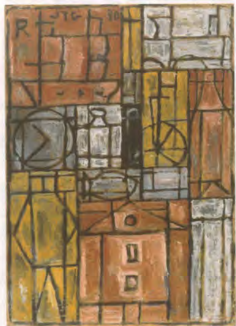
Joaquín Torres García, "Constructivismo", 1985

Joaquín Torres-García vuelve a Bruselas a exponer su sobriedad cromática, de gruesos empastes y de particular geometría